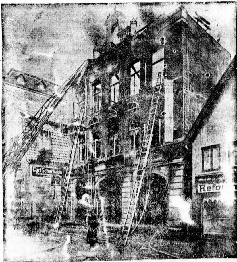
A de.mold. szanuaruz. Az égő »Zur T. übe.« szaloda A tüzaatasztólána, 3 ember meghalt, 11 súlyosan megsebesült

A betörés igen nagy feltűnést keltett Kikindán, mivel az üzlet a város központjában van, igen közel a rendőrséghez. A rendőrség erőlyesen folytatja a nyomozást a vakmerő betörők kézrekerítésére.