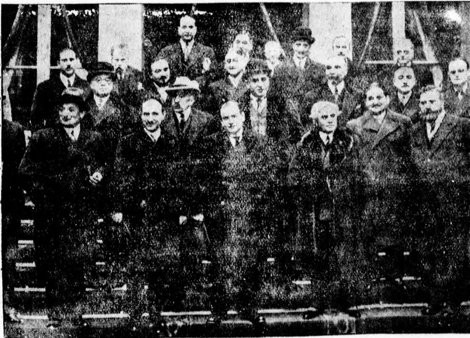
Az új francia kormány. A kormány tagjai az eskü letétel után. Balról-jobbra: Danielou (népjólté), Chautemps (belügy), Daladier (miniszterelnök és hadügy) és Paul Boncour (külgügyminiszter) az Elysee palota előtt.

A pénzügyi hatóságok a törvény rendelkezése értelmében megvonták a bormérési engedélyt mindazoktól a vendéglősöktől, akik az átalányt nem fizették ki. Szá-