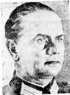
Walter ezredes, a német hadügyminiszterium új kabinetfőnöke