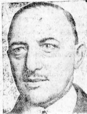
Hirt ezredes, az önkéntes munkaszolgálat új birodalmi biztosa