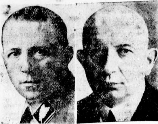
Helldorfi gróf, a berlini rohamosztágok vezetője, az új rendőrfőnök