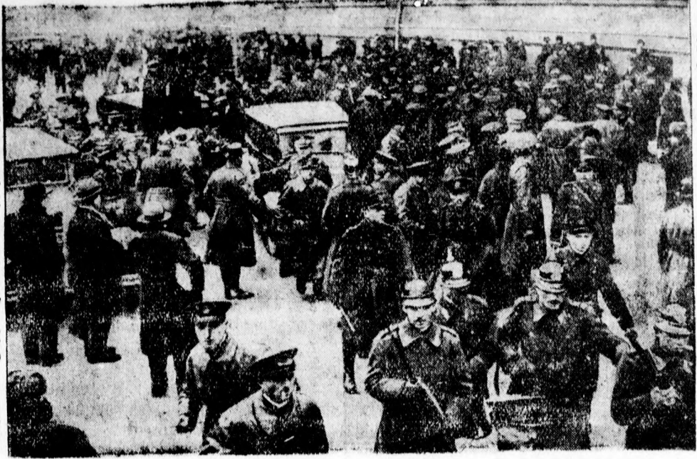
Tüntető felvonulás a román kormány ellen. Fortzu tanár letartóztatása miatt nagy tüntető felvonulást rendezett a polgárság az igazságügyi minisztérium előtt. A tüntetőket a csendőrök és rendőrök gummibotokkal verték szét.

— Influenzájánál gondoskodni kell arról, hogy gyomra és belej a természetes Ferenc József keserűvíz használata által többször és alaposan kitisztíttassanak.