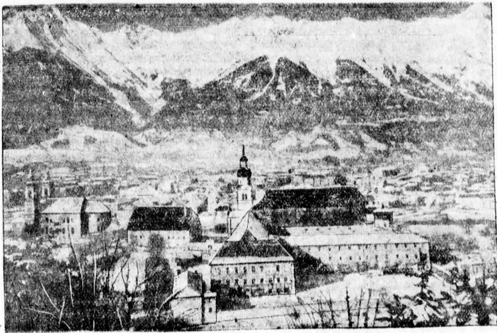
A nemzetközi siversenyek színhelye. Innsbruck látképe, a háttérben az Iselberg, a siverseny pályával

közni, de a szombat délutáni játék nem kedvez a bérni viszonyoknak. Eppen ezért úgy döntöttek, hogy az angol válogatott május 20-án, szombaton mérkőzik Zürichben. A Jugoszlávia—Svájc válogatott mérkőzést az eredeti tervtől eltérően nem Zürichben rendezik, hanem Bernben, még pedig május 7-én.