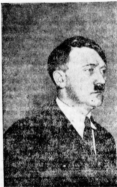
Hitler a mikrofon előtt. Hitler rádió keresztül ismertette kormány programját