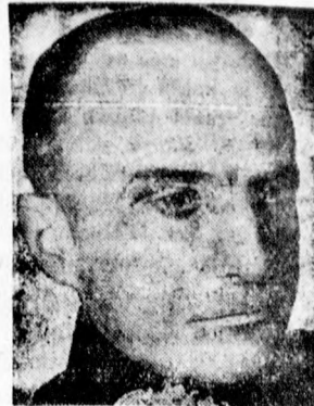
Von Brauchitsch vezér, a hadosztály új parancsnoka