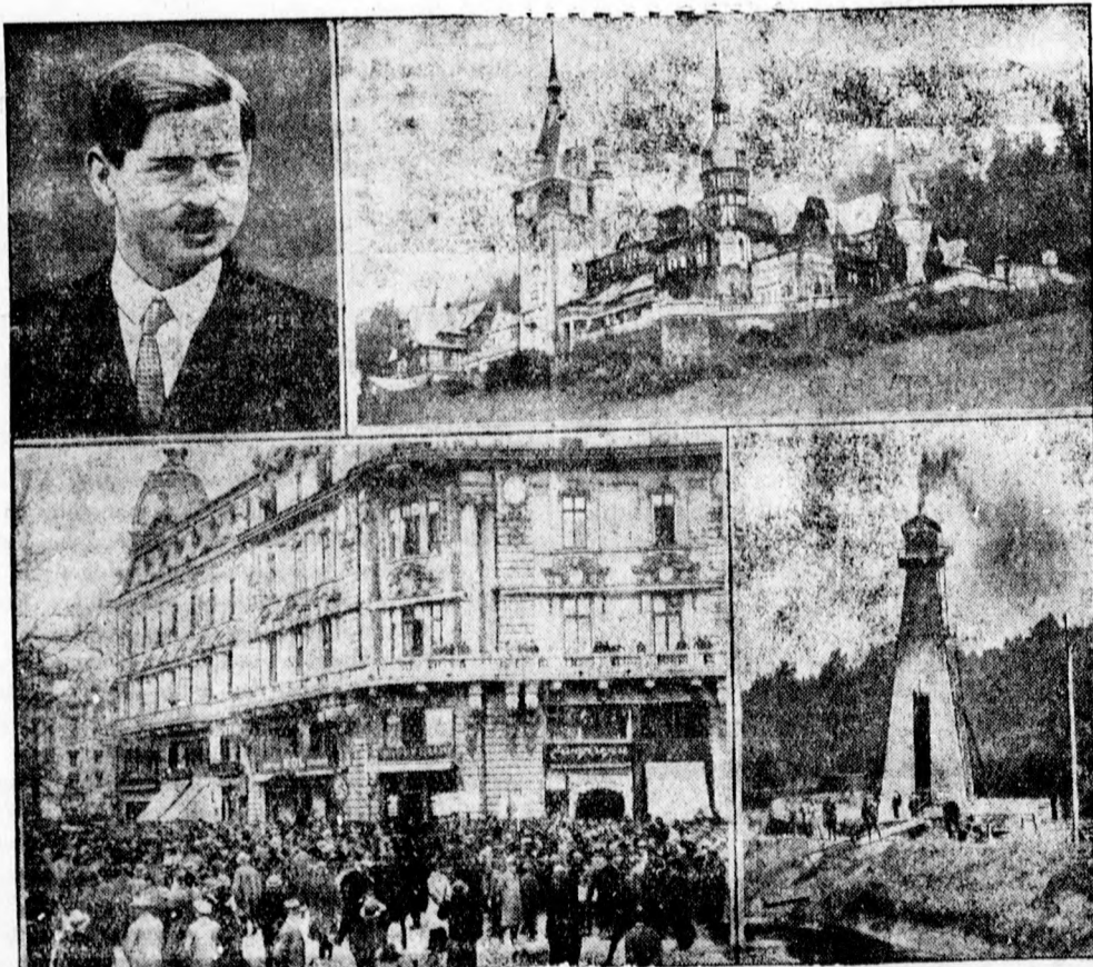
Izzó a politikai helyzet Romániában. A román baloldali pártok agitációs munkája egyre aggasztóbb méreteket ölt Romániában. Fent balra: Károly román király, mellette a sinajai királyi kastély. Balra lent: a tüntetők felvonulása Bukarestben, mellette a petroleum fűtorony Ploestiben

Vujics polgármester most a jogügyi bizottság elé terjeszti az összes erre vonatkozó aktákat, hogy döntsék el: mi a város teendője e három irányban is folyó ügyben, amelynek huzavonája tetemes összegű felszaporodását jelenti a városi költségvetésben, mert 1930 óta összesen 700 ezer dinár kötelezettsége van eddig a városnak, amiből eddig még semmit sem fizetett ki.