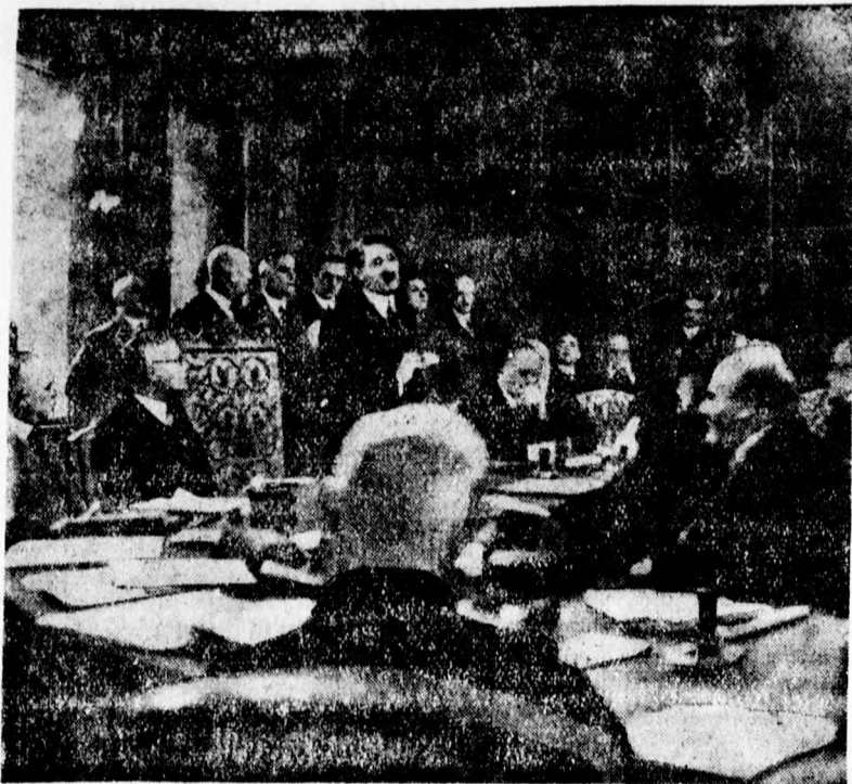
Hitler Adolf kancellár bemutatkozása a birodalmi tanácsban az egyes országrészek delegátusai előtt