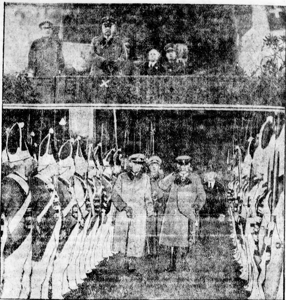
Hindenburg birodalmi elnök a lovasünnepélyen. Fent: Hindenburg (x) a diszpáholyban. Lent: Hindenburg ellép a Nagy Frigyes korabeli, úgynevezett „Jungen Kerls” őrdíszíték sorfala előtt