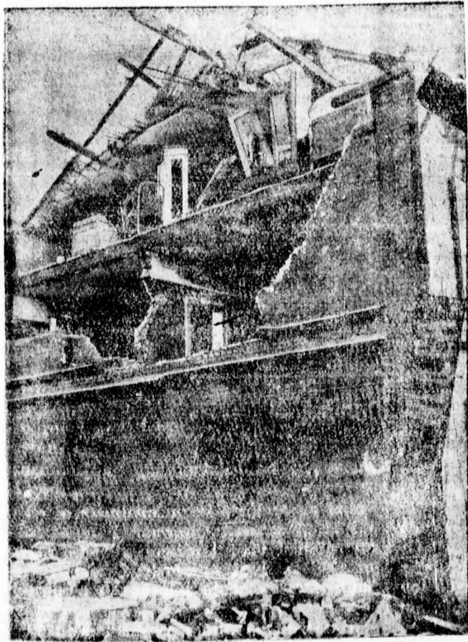
Egy lak ház oldalfalát telje en lerombolta a rázudul vesdarab és légnyomás