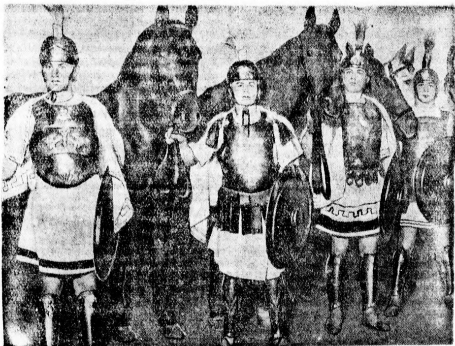
A klasszikus Olympia. Képünk a római látnivaló