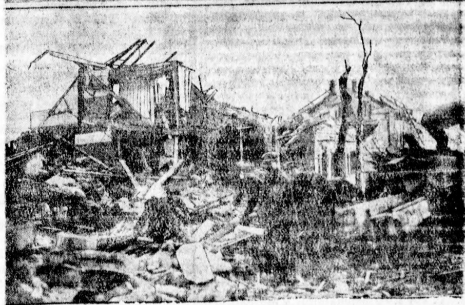
A lenyomott azometer viszálnak egy darabját 400 méternyre röpítette a robbanás ereje. Hátul az iskolaépület, melynek tetejét és összes ablakait szétzúzta a légnyomás. Lent: A lakosok teljesen szétrombolt házaik törmelékéi közt keresgélnak esetleg még használható háztartási eszközök után