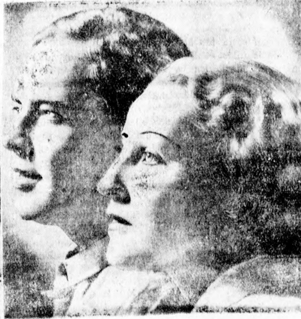
Film a sportról és háseiről. Jelenet „A maraton: lúto” új filmből, mely Los Angelesben készült