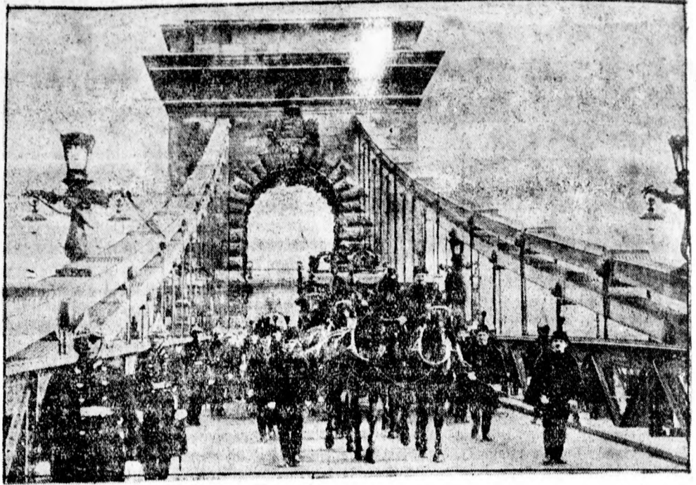
Gróf Apponyi Albert temetéséről. A gyászmenet a budapesti Lánchíd felől.