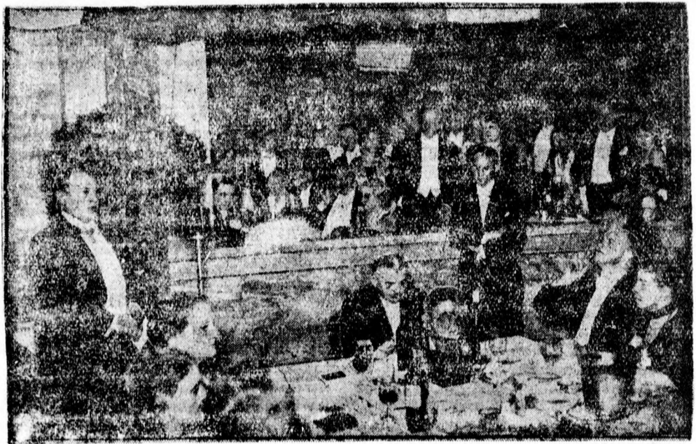
A német Aero-Club 75 éves jubileumán Göring kapitány, az új német légügyi biztos tartotta az unnepl beszédet.