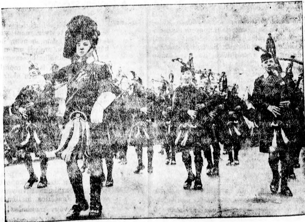
A skót diákok a nemzeti eszme és viselet istápolása végett, még kirándulásaikra is nemzeti viseletben, dudaszóval vonulnak ki.

A szövetségi elnök a lemondást nem fogadta el, hanem teljes bizalmáról biztosította Dollfuss-t és kormányát. Felkérte a kancellárt, hogy nyugodtan és szilárdan intézze tovább az állam ügyeit.