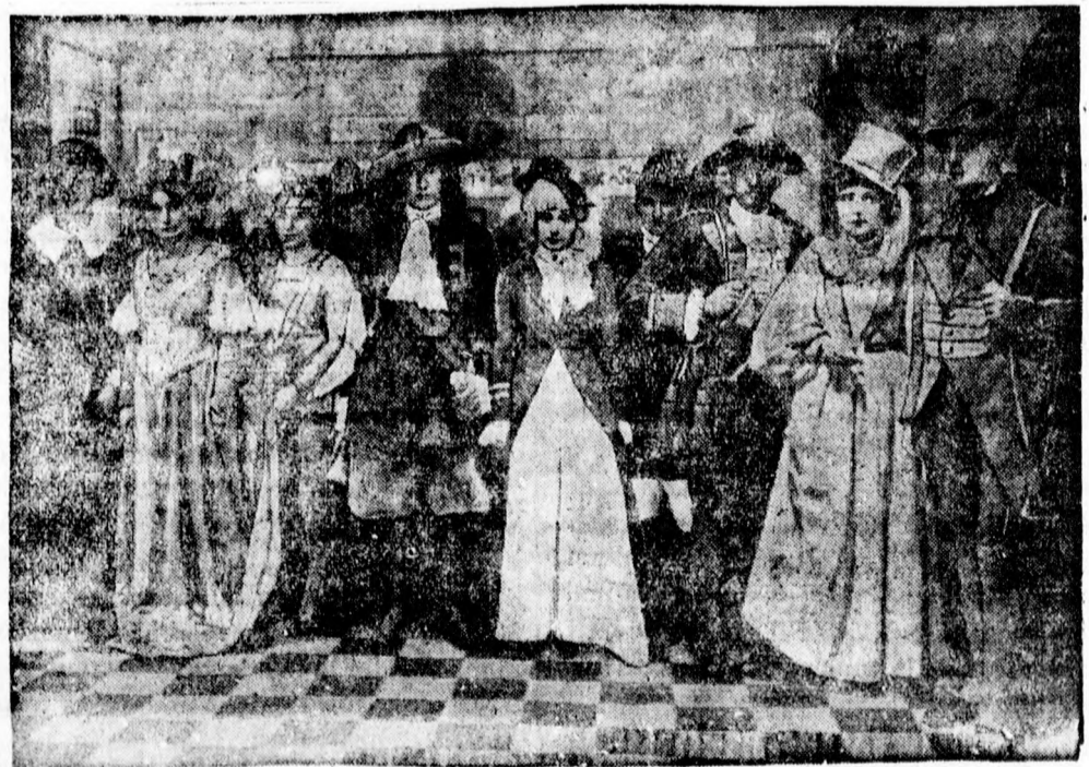
Vadászruhák fejlődése a Rokokótól napjainkig

Kronfeld osztrák vitorlázó rekordrepülő gépjével a próbastart előtt. Kronfeld gépét egy repülőgép a magasba viszi és onn an a szél erejét kihasználva akar Kronfeld Semmeringbe repülni a postával.