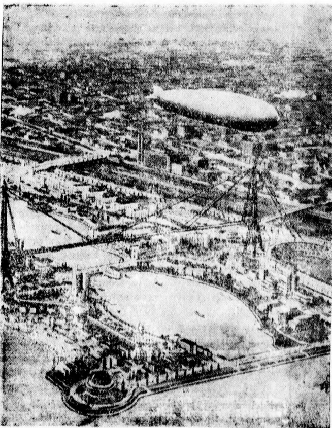
Tudniillik a kiállítás területét (előtérben) összefényképezték Csikágó város látképeivel (háttérben)

A csikágói világiállítást június 1-én nyitják meg. A kiállítás területe a Michigan tóra épített mesterséges sziget. A plakát érdekessége egy „fototrükk”. Tudniillik a kiállítás területét (előtérben) összefényképezték Csikágó város látképeivel (háttérben)