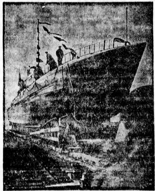
„La Sybille” új francia tengeralattjáró vizsgálatára.