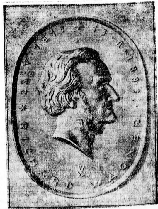
Wagner Richard plakett