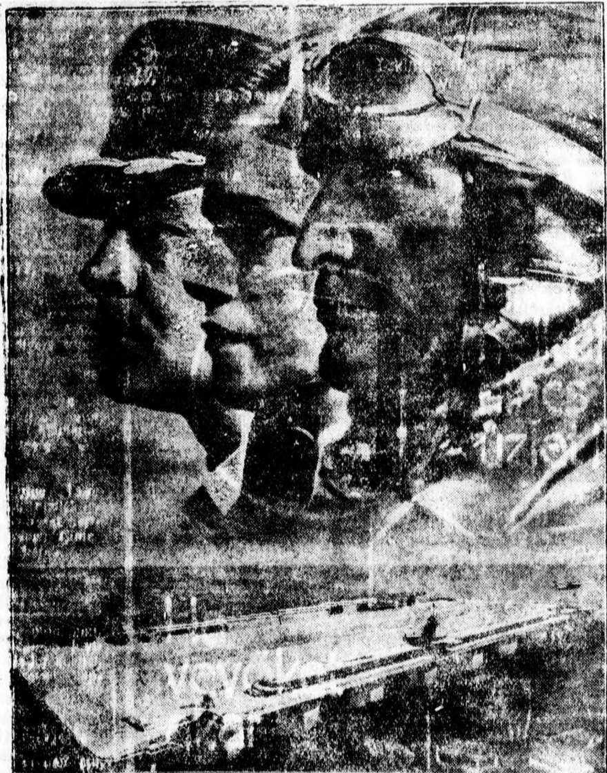
Die Drei von der F. P. I. Hans Albers, Sibylle Schmitz und Paul Hartmann spielen in dem Groß-Tonfilm der Erich Pommer Produktion der Ufa „F. P. I. antwortet nicht“ die Hauptrollen (Regie: Karel Hartl)

Hans Albers grandiózus alkotása. A XX-ik század álma, az uszó sziget!