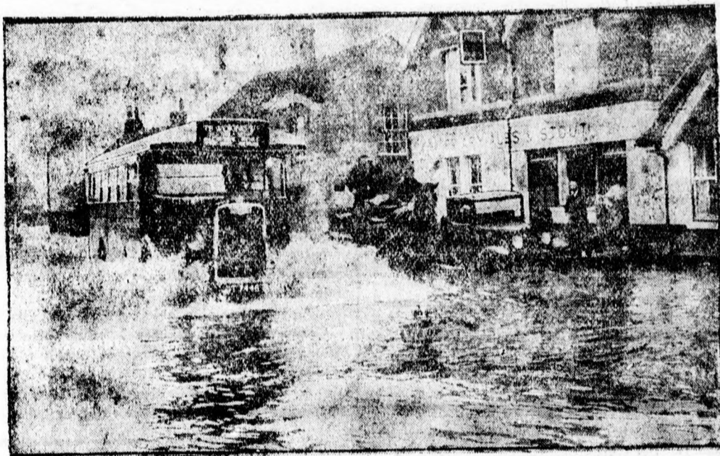
Nagy árvizek Angliában. A hirtelen beállt olvadás következtében a patakok és folyók vize kiöntött medréből és a környék falvait elöntötte. Képünk egy London környéki városka elárasztott főutcáját mutatja be.

A szociális missziótársulat vezetésével az idén télen is sikerült az ingyen ebédeltetési akciót megszervezni s a népkonyhákat megnyitni. Az akció megindítását elsősorban a katolikus hitközség áldozatkészsége tette lehetővé, mert a hitközség maga 30.600 dinár készpénz hozzájárulással szerepel az adakozók névsorában. Maga a misszió s külön annak tagjai is jelentős adományokkal járultak hozzá az akció sikeres lebonyolításához, de maga a nagyközönség is derekasan kivette részét pénz és természetbeni ajándékaival a mozgalomból. A népkonyhák felállítását az idén már csak azért is különösen fontos volt, mert a város a költségvetésbe nyomorenyhítési célokra felvetett 300.000 dinárt téli munkakalmak teremtésére használta fel. Ez helyes volt, de mindenesetre azzal a hátránnyal járt, hogy a munkaképtelenek, gyerekek ebből az összegből segélyhez nem juthattak. Így a misszió népkonyháira hárult az a feladat, hogy a keresetképtelenekről a télvi idején gondoskodjék. Heti népkonyhát nyitottak meg január 7-én a város különböző pontjain s minden konyhán 58-66 személy kapott naponta meleg ebédet és kenyeret. Pár nap előtt zárultak be a konyhák, mivel további fenntartásuk anyagi hiányában már lehetetlen volt