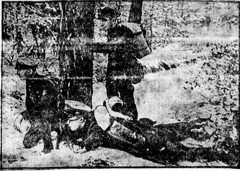
Az acélszakosok véderősportalkulatainak katonai gyakorlatai. Az előrs munkája a véderő sportalkulatok téli nagygyakorlatain.

— Vizsgák a gőzgépek kezelői és gőzkazánfűtők részére. A noviszádi gőzkazánfelügyelőségénél április 8-án vizsgákat tartanak a lokomobilkezelők, a gőzkazánfűtők és gépészek számára. Az előkészítő tanfolyam április 3-án kezdődik. Közlekedési tudnivalókat szívesen ad a noviszádi gőzkazánfelügyelőiőség. A kérvényeket április hetedikéig lehet benyújtani.