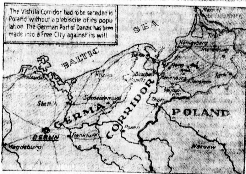
A német—lengyel viszály okozója, a danzigi korridor

— Törökország jelenleg az európai nemzetek barátságát akarja megszerezni magának, hogy azokkal versenyezve vegyen részt az emberiség életében.