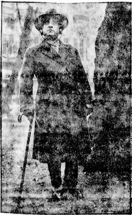
Rádó a sétatálcában

— PULLOVER-MODELLEK, solvemsálak, trikocsellem fehérnemű, bőr- és kötött készítmények, harisnyák, fűzők és melltartók — nagy választékban FISCHER J. és FIA cégnél Noviszádon Trg Oslobođenja 2.