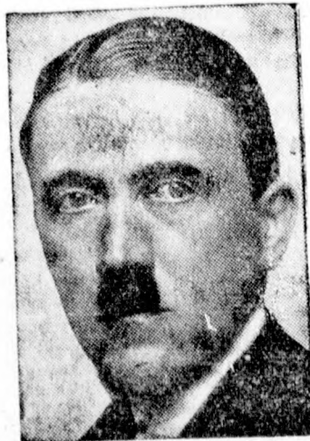
Hitler Adolf. Ugy tűnik fel, mintha zászló volna mások kezében. Magávalragadó népszónok, akinek híte saját, népélmegmen-

tő eszméiben olyan nagy, hogy mindenkit magával ragad. A szervezés az alvezérek kezében van. Róhm kapitány. A rohamosztagok megszervezője, aki mint jövődö hadügyminiszter az összes véderők ura szeretne lenni, ha Hindenburg ezt teljes erejével nem ellenezné.