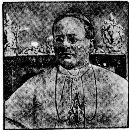
XI. PIUS pápa