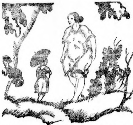
Őgy megmutatják a letűnt világot.