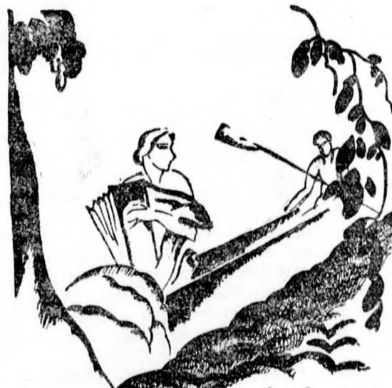
Üll édes és elomló gráciával ....

Es most még valamit, utoljára. Van itt egy tündéri nő, akit ehelyen is mélységes hódolattal ádvözlök.