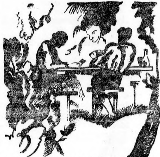
Íde járnak egy kis „snapszlira“

Igy születik meg a hétfői pótvasárnap itt a spiccen. Mert városunk derék figarói, régi kartársi szolidaritásból mind ide járnak a Horvátbácsi csárdájába egy kis „snapszlira“ meg baráti kvaterkázásra.