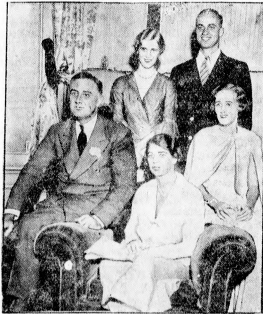
Roosevelt és családja

A család tagjai elmondták, hogy a műsze-