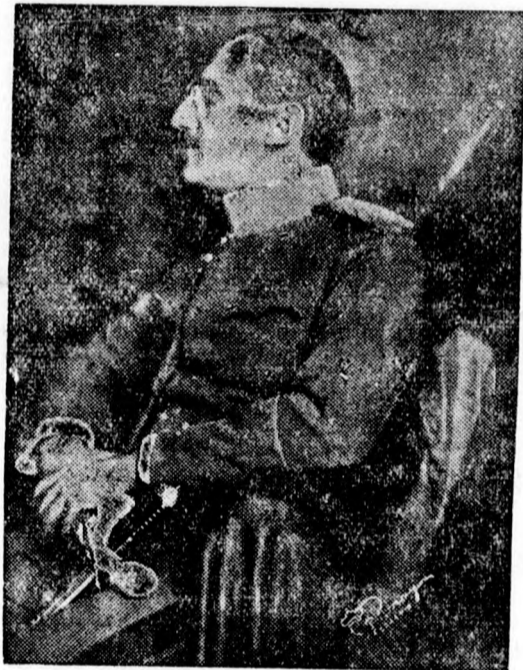
Őfelsége ALEKSANDAR király

Az ünnepélyes fogadtatás programját a legrészletesebben kidolgozták.