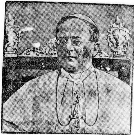
XI. PIUS pápa

Rómából jelentik: A Vatikánvárosban végrehajtott közmunkák valamint a Szentatya castelgandolfói nyaralójának átépítése hatalmas összegeket emésztettek fel. A pápa ennek következtében elhatározta, hogy teljesen átvizsgálta állami háztartását és hogy legalább hozzávetőleg megállapítsa a szentszék ingatlanainak értékét. Erre az intézkedésre már azért is szükség van, mert az új vatikáni állam létesítésével lényegesen megnövekedtek az állandó kiadások, amelyekre valamilyen fedezetet kell találni. Ennek következtében a jövőben a Vatikánváros rendes költségvetést fog készíteni, amelynek kereteit szigorúan betartják. A pápai állam költségvetésének felállításával a Szentatya hír szerint három svájci szakértőt bízott meg, akiket a legmesszebbmenő teljhatalommal ruházott fel. A szakértők a pápa elé terjesztik költségvetési tervüket és a Szentatya kijelentette, hogy szigorúan fog ragaszkodni annak betartásához, mert úgy látja, hogy tulságosan költségesek.