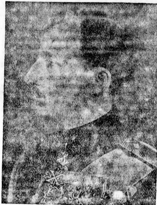
Őfelsége BORISZ király

Őfelségeik a jugoszláv király és királyné látogatása alkalmat ad a bolgárok számára, hogy kifejezésre juttathassák figyelmüket azért a szívélyes vendéglátásért, amelyben a bolgár királyi pár legutóbbi beogradi látogatása alkalmával részesült.