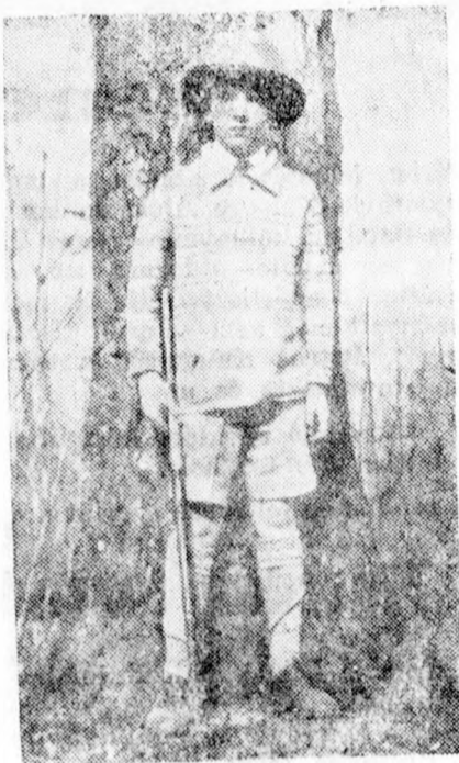
ŐFELSÉGE II. PETAR KIRÁLY

V. György angol király 12 napos udvari gyászt rendelt el és az összes udvari ünnepeket törölték.