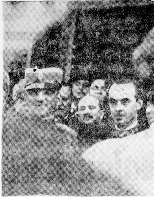
Öfelsége Alekszandar király látogatása Noviszádon, a kereskedelmi ifjuság palotájának felszentelése alkalmával

Reggel hét órától kezdve minden órában negyed óra hosszat megszólaltak az összes templomok harangjai és a felhőkbe hatoló harangzugas juttatta kifejezésre a város és lakosságának gyászát. A házakon fekete lobogók lengtek, a középületeket fekete gyászleplekkel borították, az üzletek kirakataiban Öfelsége Alekszandar király arcképét helyezték el gyászkeretben. A gyász jelül az összes iskolákban beszüntették a tanítást, a közhivatalokban munkaszünetet tartottak, az összes üzleteket bezárták. A város külső képén is látszott az a mély gyász, amelybe a marseillei merénylet döntötte a népet.