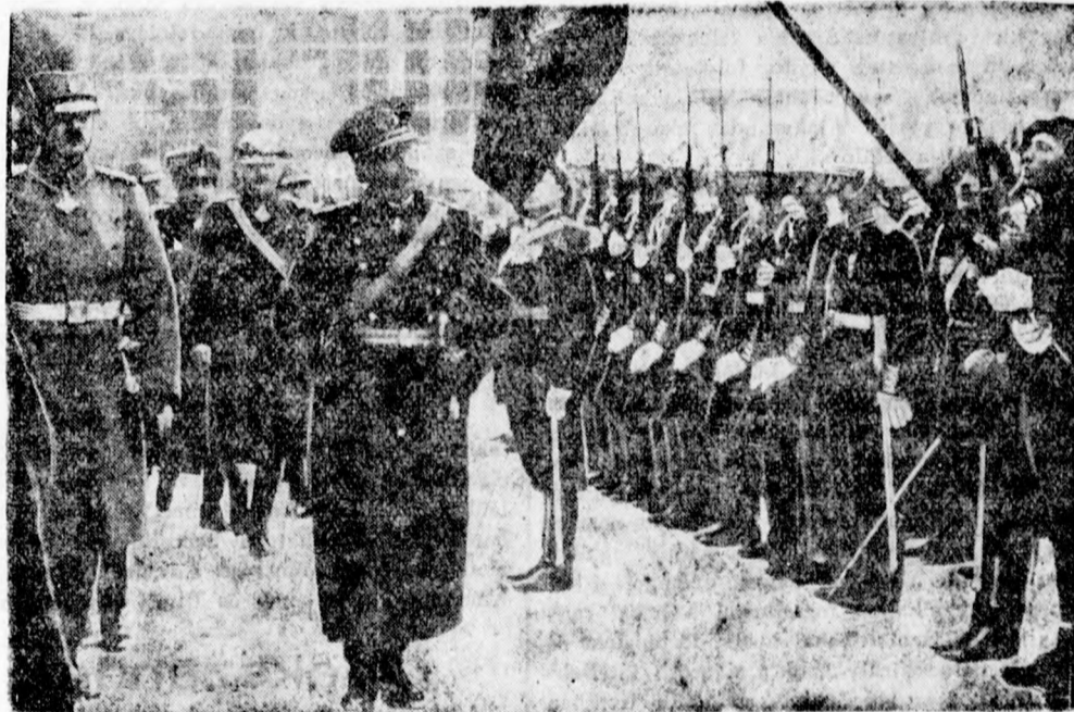
Öfelsége Alekszandar király sinajai látogatása. Öfelsége (középen) és Károly román király (Öfelségetől balra) lépnek a díszszázad előtt

Bukaresti jelentés szerint a szerda reg-