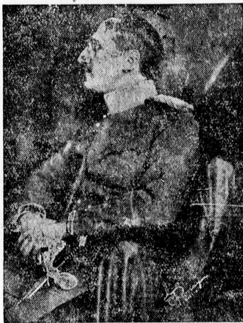
EGYESÍTŐ VITÉZ I. ALEKSZANDAR