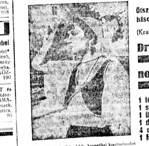
En kizárólag a dr. Stössel-féle kozmetikai készítményeket használnom Ha Rina

Egyszer 12 PAR legfinomabb tompatényú női selyemharisnya Egyszer 12 PAR legfinomabb férfi flórzokni PEREPATITS női- és férfidivat raktárából Noviszád, Futoska ulca 27.