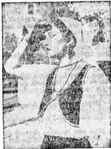
En kizárólag a dr. Stössel-féle kozmetikai készítményeket használom

Szubotica Pajo Kujundzicseva ul. 82 Telefon 5-20. 111