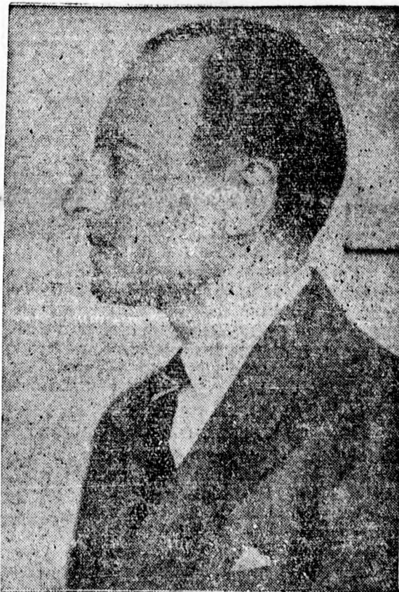
Öfensége Pavle régensherceg