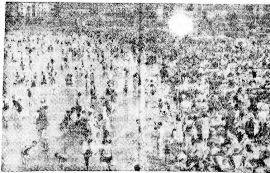
A londoniak hűsítik magukat a Temze folyón.

Bécsi sertésvásár, augusztus 13. Felhajtás 6521 hus- és 4637 zsirsertés, amelyből 276 zsirsertés vesztegzár alá került. Irányzat közepes. Arak élő-súlykilogrammonként: elsőrendű zsirsertés 1.60—63, kivételesen 1.64, öreg 1.25—1.35, parasztsertés 1.50—60, kivételesen 1.62, hussertés 1.40—1.75, kivételesen 1.80 schilling.