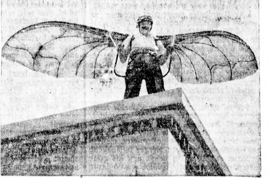
A feltalálók parisi kongresszusán egy vállalkozószellemű feltaláló bemutatta a karokra szerelhető repülőszárnyakat.