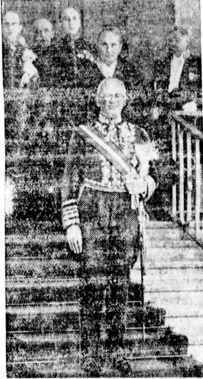
akinek Hitlernél tett bemutatkozása nagy politikai esemény volt.