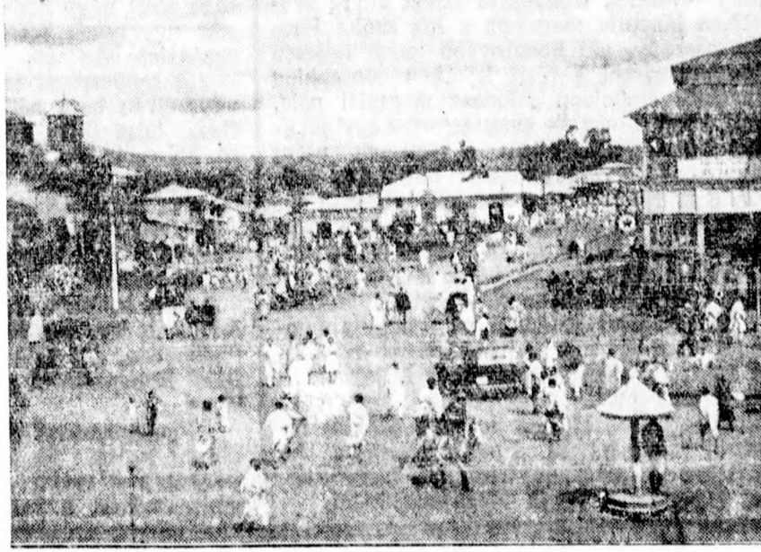
Abesszinia fővárosának főtere.