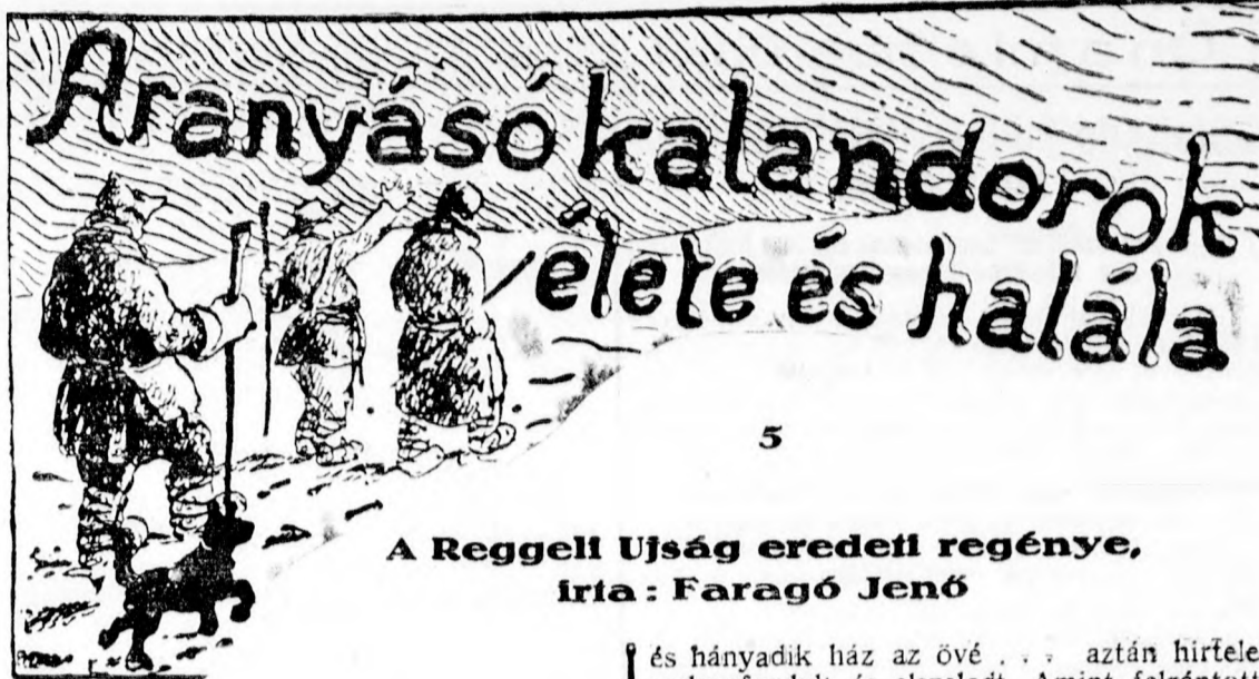
A Reggeli Újság eredeti regénye, írta: Faragó Jenő

A NOVIZSADI VENAC összes tagjait kéri, szíveskedjenek ma este 8 órakor megjelenni a Fülöp-pályán, ahol gyűlést tartunk az új vezetőség megválasztása tárgyában. A vezetőség