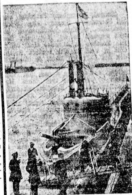
VIII. Edvárd angol király meglátogatta a legújabb angol tengeralattjáró hajót

Szombat este a zagrebi volt Szokol-teremben Délnyugat-magyarországi birkózói vendégszerepeltek. Ellenfelük Zagreb válogatott csapata volt, amely óriási meglepetésre 17:1 arányban győzött a magyar vidéki csapat felett. A győzelem még ebben az arányban is teljesen megérdemelt. A verseny hat számból állt, tuss-győzelemért 3, pontozásos győzelemért 2 pontot kapott a győztes csapat s így született meg a 17:1-es eredmény, mert a zagrebiek a 6. számból ötöt tussal, egyet pedig pontozással nyertek.