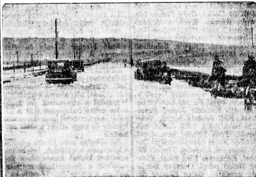
Nagy vihar volt Anglia partvidékén. A viharral együtt olyan felhőszakadás zúdult a vidékre, hogy az országutak mind víz alá kerültek

Azt írja többek közt: »Én vagyok az első, aki feleségül akar venni és senki sem szeret ugy, mint én. Rooseveltt után én leszek az elnök és megígérem neked, hogy ha háboruba kell menni, akkor te leszel az elnök.« Tudni kell, hogy a kiszemelt menyasszony 2 1/2 éves.