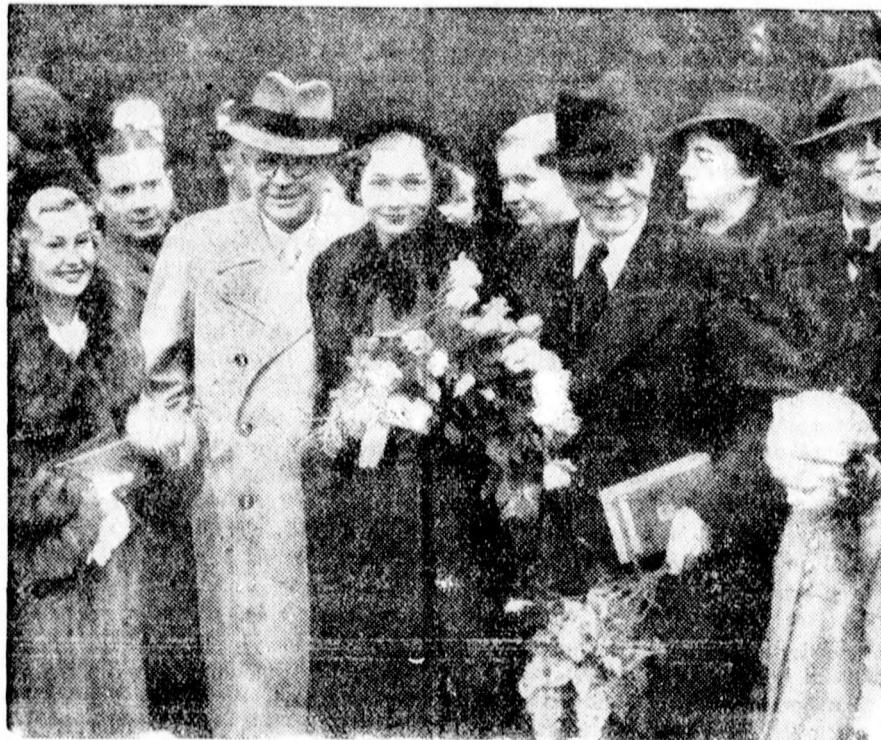
WILLY FRITSCH ESKÜVŐJE

— Műkedvelőelőadás Szivljevon. A Szivljevoji sportklub műkedvelők vasárnap, március 21-én ismét előadják a Zsindelyezik a kaszárnya tetejét című operettet.