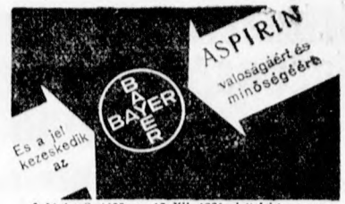
A hirdetés 1937. márc. 17. XII. 1936 alatt. Jajtranzak

fog annyira megáradni a Duna, mint 1926-ban, nem szabad azonban szem előtt téveszteni, hogy az Alpokban még nem indult meg a hóolvadás és már is ilyen magas a vízállás. Ezt kell szem előtt tartaniok az illetékeseknek, mert valószínű, hogy