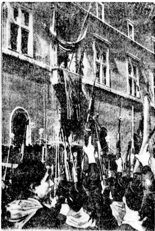
Mussolini Afrikából való visszatérése után nagy beszédet mondott az angol-olasz viszonyról a Palazzo Venetia erkélyéről az összegyűlt fasisztáknak.

Az ír szabadállam az angol birodalmi értekezlettel szemben nem foglalt el sem pozitív, sem negatív álláspontot — mondotta, — hanem egyszerűen semmibeveszi ezt az értekezletet.