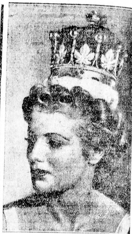
AZ ANGOL KORONÁZÁSI ÜNNEPÉGI HAJVISELETE