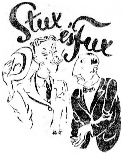
az őszi vásárról

(Szín: a lakberendezési vásár. Az Iparcsarnokban találkozik Stux és Fux.)