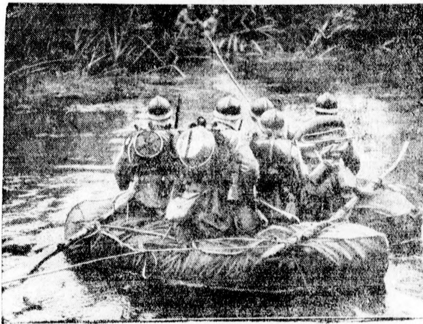
NAGY HADGYAKORLATOK FRANCIAORSZÁGBAN. Normandiában, Alencon közelében nagy hadgyakorlatokat tartott a francia hadsereg. Képünk a gyalogság átkelését mutatja az Orne folyón.

Londonból jelentik: Az összes angol lapok beható bukaresti jelentésekben emelik ki, hogy a román kormány legközelebb kiutasítja az összes idegen alattvalókat, hogy így minden állás kizáróan románoknak juthasson. A Daily Telegraph hangsúlyozza, hogy még a közlekedési vállalatok francia, angol és amerikai alattvalókat is kiutasítják. A Morning Post értesülése szerint Bukarest ipari körében is súlyos aggodalmat keltett a kormány lépése, mert Romániában igen jelentékeny angol, amerikai és francia tőkét ruháztak be.