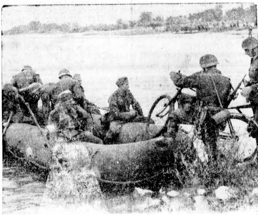
A NÉMET HADGYAKORLATOKRÓL. A III. német hadtest gyakorlatozó csapatainak egyik előőrsé átkel az Odera folyón.

— Mussolini Benito, a Duce, az olasz nép vezére és az olasz kormány feje, hétfőn, 27-én mint a Vezér vendége, háromnapos hivatalos látogatásra a harmadik birodalom fővárosába érkezik. Berlin egész lakossága büszkeséggel és meglepedéssel üdvözli annak a két személyiségnek találkozását, akiknek történelmi alkotásai kivételes jelentőséggel bírnak a jelenben és a jövőben egyaránt. Berlin lakossága különösen boldog, hogy lelkesedésének és hálájának