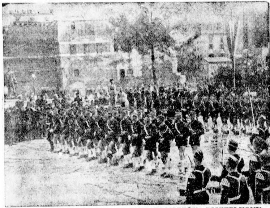
NÉMET HITLER IFJAK AZ IFJU FASISZTÁK DISZFELVONULÁSÁN. A Róma melletti Campo Dux táborban 26.000 ifjufasiszta diszfelvonulását az ott levő Hitler ifjak csoportjai nyitották meg.