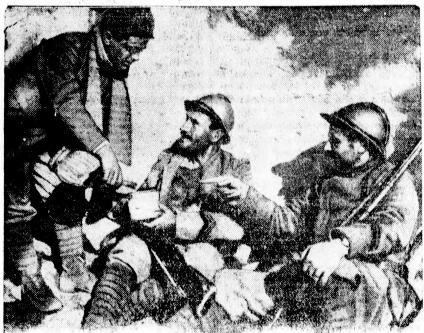
MUSSOLINI, MINT KÁPLÁR A VILÁGHÁBORUBAN. Benito Mussolini olasz miniszterelnök a világháborúban egy bersaglieri ezred káplárja volt, Mussolini káplár igen vitézül harcolt és amikor megszegett, Viktor Emanuel olasz király is meglátogatta a tábori kórházban, anélkül, hogy sejtette volna, hogy ez a káplár lesz a római világbirodalom megalapítója.