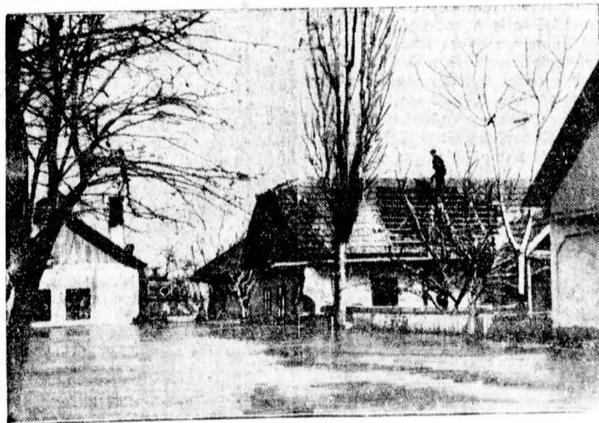
A magyarországi Borsód-megye felső részében nagy árvíz pusztított. A képünkön látható Sajónémeti falucskában 10 ház dőlt össze.