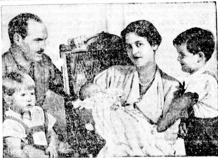
Donatus hesseni örökös nagyherceg a családjával, amelyből a multheti repülőszerencsétlenség után csak a legkisebb gyermek van még életben. A két nagyobbik fiú a szülőkkel együtt a szerencsétlenség áldozatául esett.

A Magyar Királyi Államvasutak igazgatósága ismert előzékenységgel szintén díjmentesen bocsátotta rendelkezésünkre a hivatalos magyarországi menetrendet. Magyarországra utazó olvasóink tehát vagy személyesen, vagy telefonon érdeklődhetnek kiadóhivatalunkban vagy a szerkesztőségben bármilyen fő vagy helyi érdekű magyarországi vonat menetrendje iránt s természetesen díjmentesen nyújtunk felvilágosítást minden érdeklődésre.