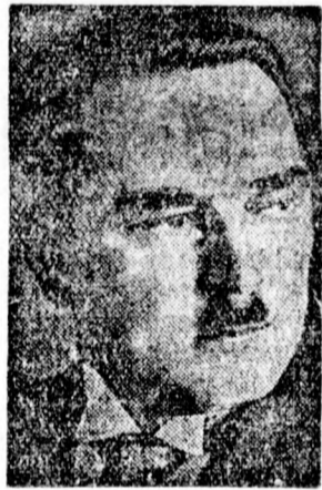
Dr. Sztojadinovics Milán

A világpolitika mozgalmas harterén dr. Sztojadinovics Milán jugoszláv miniszterelnök-külgyminiszter római és Yvon Delbos francia külügyminiszter középeurópai útja a legjelentősebb esemény. Mindkét út szoros kapcsolatban van lord Halifax mult heti németországi látogatásával, illetőleg az angol és francia diplomáciának azzal a törekvésével, hogy a gyarmati kérdés mellett s azzal összefüggésben a középeurópai kérdést is rendezzék. A két államférfi nagy érdeklődéssel kísért utjáról alábbi értesüléseink számolnak be: