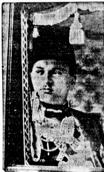
Faruk egyiptomi király

A jeruzsálemi pályaudvaron szombaton délután arab banda fegyveres támadást intézett a gyalogjárók ellen. A támadásnak egy halott és több sebesült áldozata van.