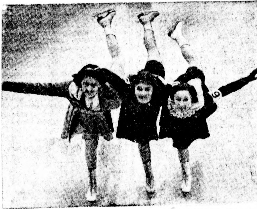
Cecil Colledge, aki tavaly a garmischpartenkircheni olimpián nemcsak tudásával, hanem szépségével is nagy feltűnést keltett, az idén is megnyerte Anglia női műkorcsolyázó bajnokságát. Képünkön Cecil Colledge közepén látható a második és harmadik helyezett Pamela Steplany és Brenda Stroud társaságában

— Szóval valni akar a feleségtől? — Igen. Még hozzá közös megegyezéssel válnak. — Gondolja meg ezt a dolgot, barátom. — Még mit nem? Hiszen ez az első eset, mikor valamiben mind a ketten megegyezünk.