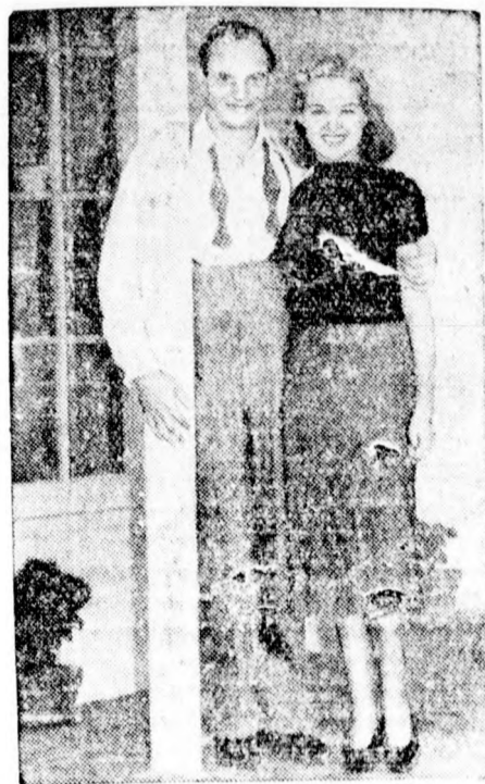
Jackie Coogan az egykori gyermekszínész Jack lett és meg is nősült. Képünk az egykori gyermekfilmsztárt mutatja fiatal feleségével. Jack Coogannak nincs olyan jó sora, mint Jackienek volt és külvárosi színházakban kell fellépnie, hogy megkeresse kenyerét.