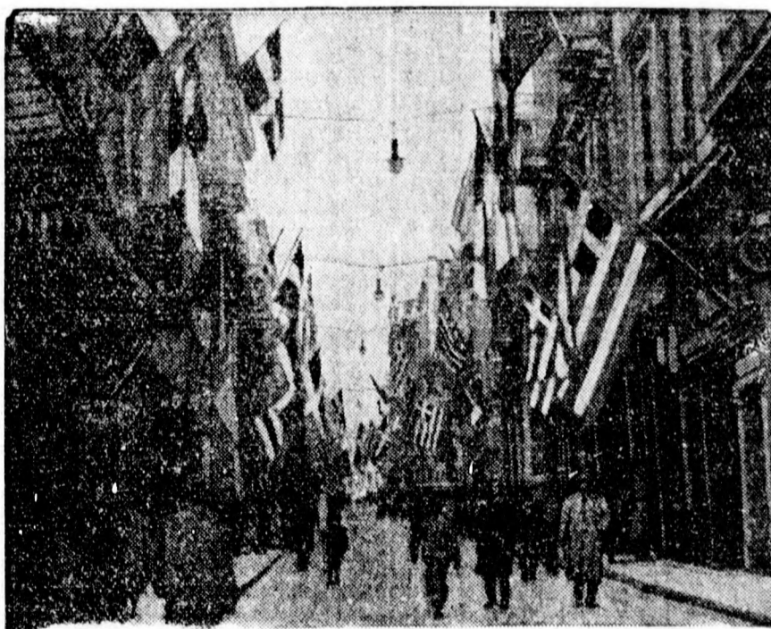
ATHÉN ZÁSZLÓDISZBEN. A görög főváros gazdag zászlódiszt öltött már Pál trónörökös esküvője előtt.

Az ajándékok olyan tömegben érkeztek, hogy már senkise tudja számontartani őket. A kormány az ifjú pár részére a Psychikon két villát vásárolt, a történelmi emléket Syniossogliu-kastélyt és egy szomszédos kis palotát. A két ház vételára tíz és félmillió drachma volt. Plytas, Athén polgármestere Londonban egy hatvanszemélyes étkezőszervizt rendelt, tiszta ezüsből, amelynek mása az angol király birtokában van. A yachtklub, amelynek Pál herceg buzgó tagja volt, különösen szép és értékes ajándékkal kedveskedett. Berlinben megcsináltatta a híres mykeni tör szinaranyból és elefántcsontból készült másolatát. A másolat elkészítéséhez a tört az athéni nemzeti múzeum bocsátotta rendelkezésre, azzal a kikötéssel, hogy e nagyjelentőségű mykeni emlék ez első kópiaja egyúttal a legutolsó is lesz. Soha többet nem lesz szabad a mykeni tört lennőlni. A görögországi gyárak legjobb készítményeikkel kedveskedtek: selyem és brokát függönyökkel, fehérneműkészlettel, autókkel, még hajókkal is. De alig van magános, aki ne adott volna valamit. Egy stadion-uccai sarki gyümölcsárus ötkiló almát küldött a palotába. Pál herceg személyesen ment be a boltba, hogy megköszönje a gyümölcsárus figyelmét. Az iskolákban is gyűjtések folytak és a diákok és tanulók spontán adományai egész vagyont tettek ki. A királyi udvarhölgyek