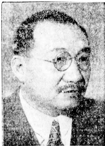
Dr. KUNG KINAI MINISZTERELNÖK

Több miniszter javasolta, hogy Japán hívja vissza kínai követét.