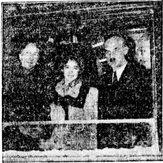
Friderika Lujza görög trónörökös, édesanyjával és édesapjával a volt braunschweigi hercegi párral utban Anhen felé.

Athén népe, amely már napokkal előbb készülődött a vasárnapi esküvőre, számban nagyon megsaporodott vasárnapra. Már a kora reggeli órákban sok százereznyi tömeg lepte el a királyi palotától a székesegyházig terjedő utvonalat, hogy szemtanuja legyen annak a pazar látványosságnak, amit a nászmenet felvonulása jelent. Az athéni székesegyházba a hatvanhat fejedelmi vendég kivül a görög közélet vezetői kaptak csak meghívást, kiknek háromnegyed tíz óráig el kellett foglalniuk helyeiket.