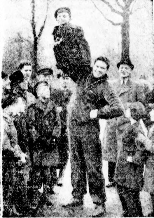
1. kép: Max Schmeling a Hamburg melletti Friedrichruhban készül a Ben Foord elleni mérkőzésére s még a képünkön látható kedélyes edzési alkalmat is megrakadja izmai erősítésére. — 2. kép: Ben Foord, aki január 30-án Max Schmeling ellenfele lesz, Hamburg városligetében így népszerűsíti magát.