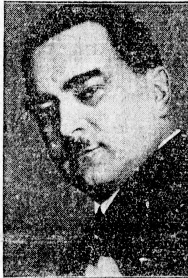
Dr. Sztojadinovics Milán

lozza és ezért nemes ellenfélként állottak szemben egymással. Amint elmúltak ezek a szomorú napok mindkét oldalon azonnal hozzálltak a régi légkör megteremtéséhez.