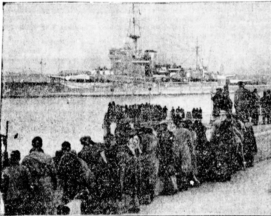
ANGOL HADHAIJÓ INDULÁSA A FÜLDKÖZI TENGERRÉ. A 31.100 tonnás »Warspite« nevű angol cirkáló elhagyja Portsmouth kikötőjét és a Földközi tenger felé indul, hogy felváltsa Dudley Pounts admirális »Barham« zászlóshajóját. A hajót 1931-ben 2.350.000 font (550 millió dinár) költséggel átépítették és nyolc darab 38 centiméteres ágyúval szerelték fel.

A távolkeleti harctéren a japán tüzérségnek nem állanak mindig jó hidak rendelkezésére. Néha bizony csak pallókon keresztül tudnak továbbjutni. Képünk is azt mutatja, amint a tüzérek szétszedték ágyújukat és egy kezdetleges hidon viszik keresztül a kerekeket, ágyucsövet és egyéb alkatrészeket.