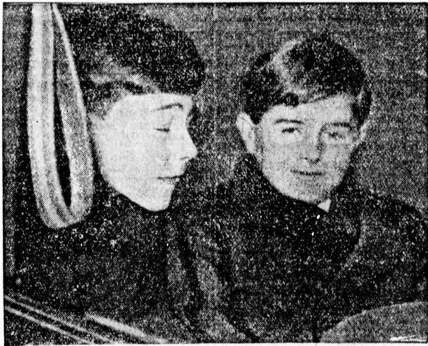
ÖFENSÉGEIK TOMISZLÁV ÉS ANDREJ HERCEGEK ANGLIÁBAN, AHOL TANULMÁNYAUKAT FOLYTATJÁK. Öfenségeik a napokban jöttek Londonba Öfelsége Mária királyné kíséretében. A két herceg Nikola herceggel Öfensége Pavle régensherceg fiával a Surryben együtt a Sandroyd iskola növendékei lesznek.

Isztambulból jelentik: Dzsela Bajar török miniszterelnök a török és külföldi sajtó képviselői előtt kijelentette, hogy Törökországban sem zsidó-, sem más kisebbségi kérdés nem volt és nem is lesz. Kemal Ataturk Törökországának minden polgára egyenlő jogokat élvez és egyformák a kötelességei is. Mint ahogy a kemalizmus nem kivételi cikk — mondotta —, ugyanúgy nem akarjuk más államok politikai rendszereit sem utánozni. Törökország nem lesz más államok vagy államcsoportok uszályhordozója. Törökországnak a többi államhoz való viszonya kielégítő, a Balkán-szövetséghez pedig szívélyes kapcsolatok fűzik.