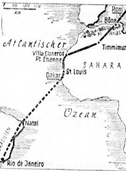
Az olasz repülők útja Rómától Rio de Janeiroig

szát azzal az uttal, amelyet az Egyesült Államok légi haderejének 18 gépe tett meg Sandiego és Honolulu között. Az olasz repülők a Guidonia és a nyugatafrikai Dakar közti 4500 kilométert 10 óra 47 perc alatt tették meg, míg az amerikai repülők 20 óra 12 perc alatt repültek át a 4150 kilométeres távot.