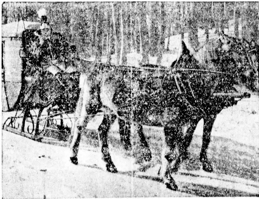
AZ UTOLSÓ LOVAS POSTA NÉMETORSZÁGBAN. Egész Németország területén most már csak egy lovasposta van, még pedig Felső-bajorországban Dietramszell és Holzkirchen között. A romantikus multnak ez a maradványa annyira kedvelt, hogy a német posta a birodalom más szép vidékein is bevezeti ismét a lovaspostát.

Tanészközképpen mindenfajta kocsis, tüzes lipicaiok és kiszolgált, az állatvédő egyesület gondozásában álló vén flákkergek állanak rendelkezésre. Minthogy a már vázolt körülmények folytán a kocsisok iránti kereslet egyre nő, s a bécsi kocsisegyetem végzett növendékei kétségkívül előnyre számíthatnak, érthető, hogy az új intézmény iránti érdeklődés igen nagy