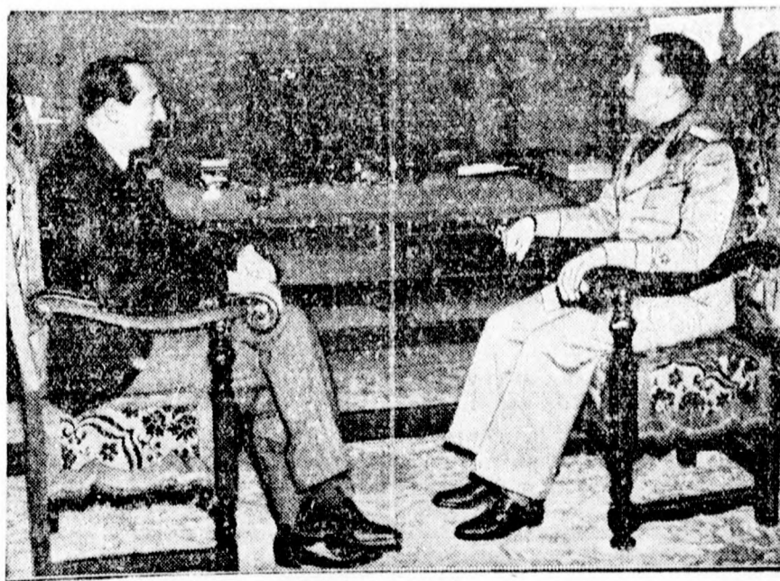
Beck lengyel külügyminiszter (baloldalt) és Ciano tárgyalnak a római külügyminisztérium palotájában.

Ugorica városelnök a költségvetési tervezet expozéjában megemlíti, hogy az ideai 1938-39. évi költségvetés összege pontosan nyolc millió dinárt tesz ki és egy millió 118.319 di-