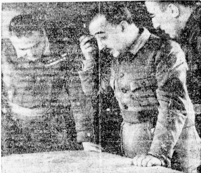
Francó tábornok az új offenzíva előtt megbeszélést tart tábornokaival.

Összeomlóban a köztársaságiak ellenállása — A nemzetiek 50 kilométerre vannak a katalán határtól