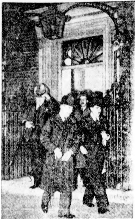
Az angol hadianyaggyárok képviselői eltávoznak a miniszterelnökségi palotából, ahol Chamberlain miniszterelnökkel tárgyaltak az angol fegyverkezés kérdéséről.