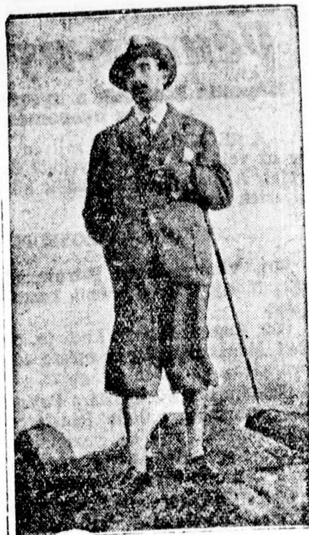
Borisz bolgár király szenvedélyes turista és minden szabad idejét a középbulgáriai hegyekben tölti.

— Ilyen a szerencse Singaporeban. A singaporei löversenyorszájék főnyereményét ötven hongkongi kínai nő nyerte. A boldog nyertesek, szerencsőjük öröme, hatalmas lakomát csaptak Kwantung kínai tartományban levő szülőfalujukban. Működő a jókedv tétpontjára hágott, fegyveres rablók hurcolták el az egész társaságot, hátrahagyott üzenetükben figyelmeztetve a hozzártartozókat, hogy ha egy héten belül nem küldik meg az egész nyereményt a rablók székávarába, az ötven nyertes levágott fejét fogják megkapni.