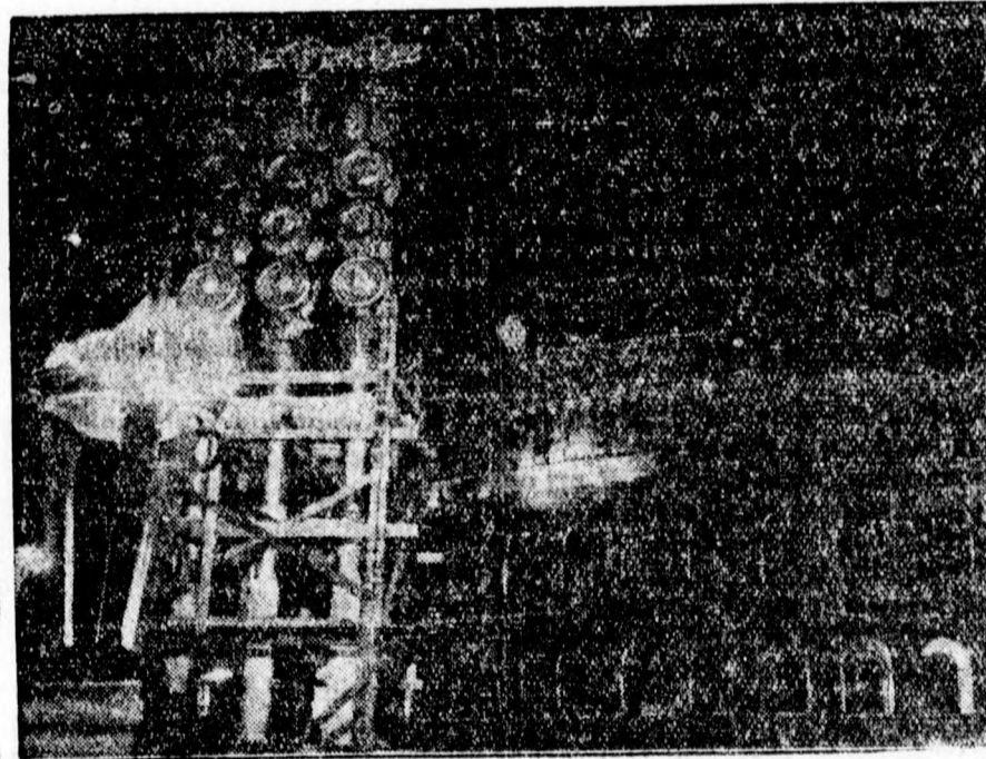
A Colosseum pompázatos fényárban fogadja a német kancellárt

kál való történelmi kapcsolatait. Ha jobban a mélyére nézünk az ügynek, talán azt láthatjuk, hogy ez a látszólagos páfordulás az angolok által szőtt nagy diplomáciai háló egyik szeme. Barátság Olaszország felé Anglia, Franciaország és Csehszlovákia részéről, hogy a »tengely« a Rómára helyezett ilyen nagy barátságai súly következtében a Brenner hágóján kettétörjön... Akár így van, akár nem, most nem ezt az eshető-