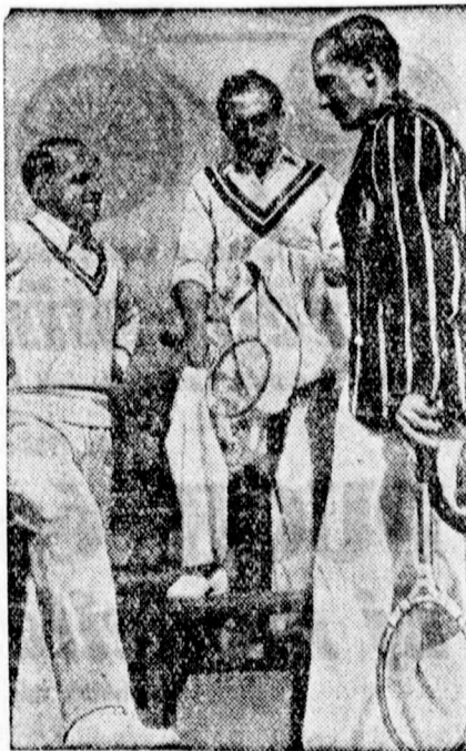
Németország Davis-Cup játékosai edzés közben

Nerz Ottó németbirodalmi edző kijelölte a világbajnoki válogatott keretét. A 22 játékosból álló keretbe 9 bécsi futballista jutott be.