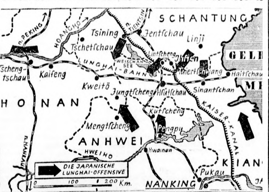
A kínai lunghai vasut mentén folyó ütközet térképe A nyilak a japán előnyomulás irányát mutatják