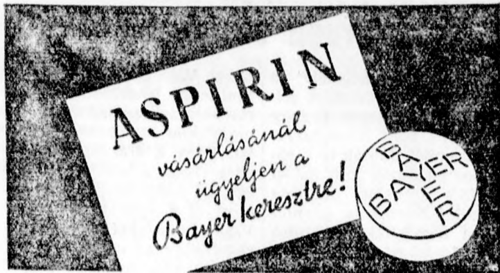
A hirdetés. S. 181 sz. I. III. 1937 alatt lajstromozva.

Vasárnap, június 5-én: Reggel 4 órakor zenés ébresztő. Reggel 8 óráig a vendégek fogadása a vasútállomáson. 8.30 órakor indulás Kiss Istvánné zászlóanyához a zászlóért. 9.30 órakor ünnepi istentisztelet a tűzoltók és meghívott vendégek részére. 11.30 órakor zászlószentelés, utána a zászlószegkek beverése. 12 órakor az összes tűzoltócsapatok díszfelvonulása a beszentelt új zászló előtt, utána a csapatok bevonulása a közös ebédhez. 1.30 órakor ünnepi bankett Herrnhutter Imre vendéglőjében. 14 órakor az összes csapatok kivonulása a versenyterre. 15 órakor a tűzoltó versenyek kezdete, ezek után a tűzoltózenekarok versenye. 20 órakor eredménykihirdetés és a díjak kiosztása. Utána több vendéglőben táncvigalom reggelig.