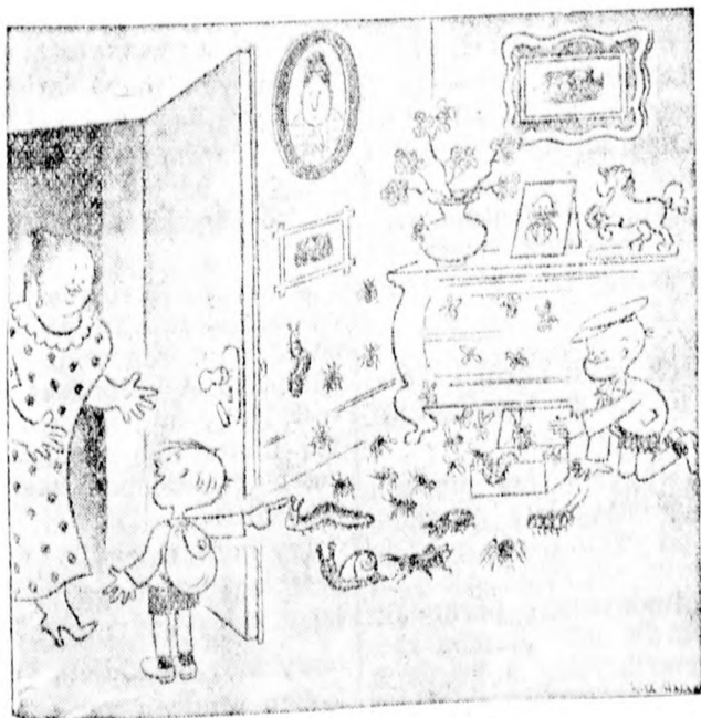
Tanulmányi kirándulás után »Nézd, anyuka, ki mindent hoztunk haza!«

— Menyasszonyi ruhában követte férjét a halálba egy gazdag hindu asszony. Diwan Ajit Singh, dúsgazdag jhansii (India) földesur halálosan megbetegedett. Felesége, amikor az orvosoktól értesült, hogy férje menthetetlen, kijelentette, hogy házassági fogadalma értelmében a halál sem választhatja el férjétől és meg fogja őt előzni a túlvilágon. Felöltötte menyasszonyi ruháját, felvette valamennyi ékszerét, megcsókolta csecsemő gyermekét, majd a házastársi engedelmisség jeléül mélyen meghajolt férje előtt, lábát megérintette kezével és utána szívenlőtte magát. A férj odakuszott holttestéhez és ott élettelenül összeszereskedt. A két holttestet közös máglyán hamvasztották el.