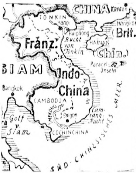
Francia-Indokína, Hainan és a Paracelsus-szigetek

Japán — mint jelentettük a tókiói francia nagykövethél jegyzékben tiltakozott a Paracelsus-szigetcsoport megszállása ellen. A tiltakozás nagy figyelmet keltett Párisban. A Jour hangoztatta, hogy ha helye van vitának, akkor az csak Annam és Kína között folyhat, mert a szóbanforgó szigetek sohasem voltak Japán birtokában. Az Epoque rámutat arra a veszedelemre, amely Indokínát a Japán előretörés következtében fenyegeti.