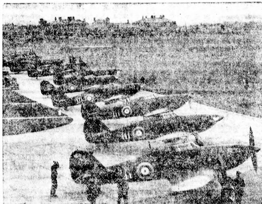
A legújabb angol harcigépek, a világ leggyorsabb repülőgépei. Ezek a gépek most új rekord kísérletre készülődnek, amennyiben a London—Párizs közötti utat fél óra alatt akarják megtenni. Képeink a London közelében levő northolti repülőtéren mutatja a gépeket, a párizsi start előtt.

akarnak gépeikkel lebonyolítani. A német gépek minden harmadik nap indulnának, viszont a közlekedés megszakitás nélkül egész éven át tartana, míg az északi útvonalon csak a nyári időszakban lehet a rendszeres forgalmat fentartani.