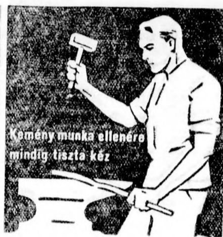
Kemény munka ellenére mindig tiszta kéz

a higgadt külpolitikát, amely minden esetben hidegen tudja mérlegelni, hogy mi a nemzet igazi érdeke és elleni tud állni veszély esetén úgy a külföldről jövő nyomásnak, mint