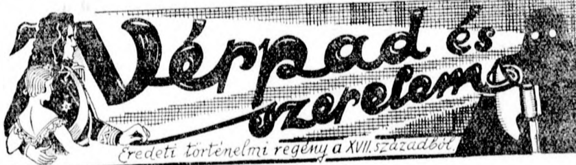
Eredeti történelmi regény a XVIII. századból

Hona borus lélekkel, szomorú szemmel tekintett a bizonytalan jövőbe, a két gyermeknek azonban a hosszú munkácsi fogság után vajmi nagy újdonság és gyönyörűség volt az utazás, a sok változatos kép, a sok apró ka-